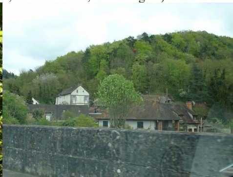
L'éperon vu de la vallée